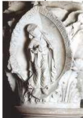
Femme jouant de la cymbale