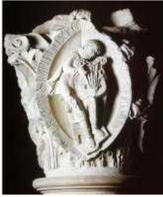
Jeune homme jouant du psaltérion