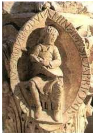
Jeune homme jouant du luth

Détruite à la révolution, il ne reste quasiment rien de l'immense abbaye de Cluny, qui fut le plus grand édifice religieux du monde, avant la construction de Saint Pierre de Rome. Le septième chapiteau du chœur de Cluny illustre les quatre premiers tons :