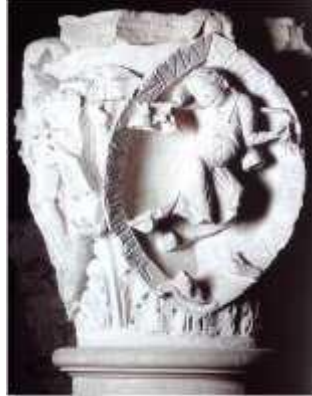
Jeune homme jouant du Tintinabulum, sonnante le glas funéraire