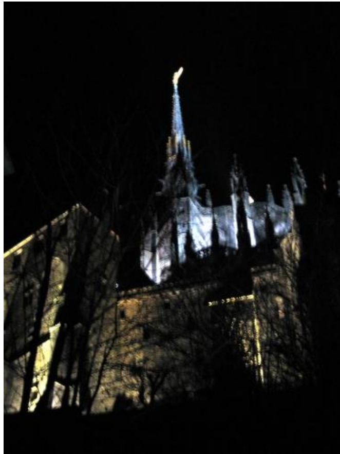
Mont Saint Michel.