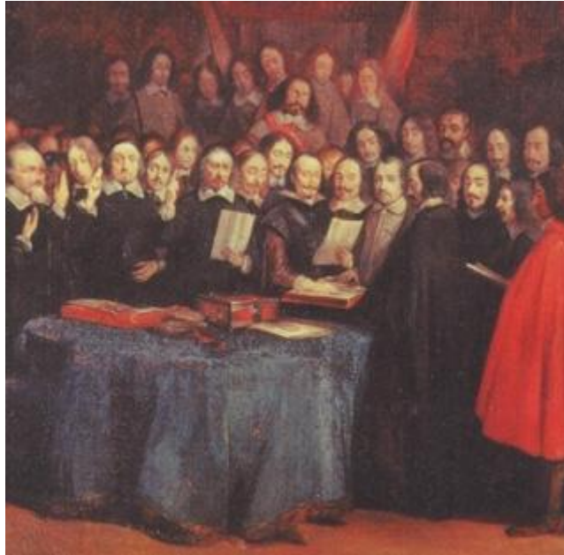
Signature des Traités à Münster

Le principe de l'équilibre européen, fondé par le traité de Westphalie, reposait sur une véritable élimination de l'Allemagne, ce qui resta notre doctrine constante, parce que c'était notre plus grand intérêt, jusqu'à la fin du dix-huitième siècle. Enfin pour conserver ces résultats, pour empêcher qu'il y fût porté atteinte et que l'Allemagne fût conduite par une seule main la France, ainsi que la Suède, avait un droit de garantie au nom duquel elle pouvait s'opposer à tout changement de la Constitution de l'Empire, à toute redistribution des territoires, en d'autres termes aux ambitions de la maison d'Autriche ou de tout autre pouvoir qui reprendrait son programme de domination des pays germaniques. L'Allemagne n'était plus, comme disait plus tard Frédéric II, qu'une « République de princes », une vaste anarchie sous notre protectorat. Ruinée, dépeuplée par la guerre de Trente Ans, réduite à l'impuissance politique, elle cessait pour longtemps d'être un danger. Nous aurions encore à nous occuper d'elle. Nous n'avions plus à craindre ses invasions : la grandeur de la France date de cette sécurité.